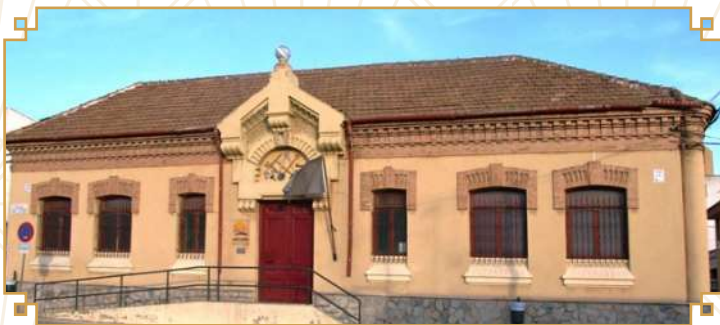
LICEO DE OBREROS (1901)

T ambién destacan, de esta época, numerosos panteones del cementerio Municipal de La Unión.