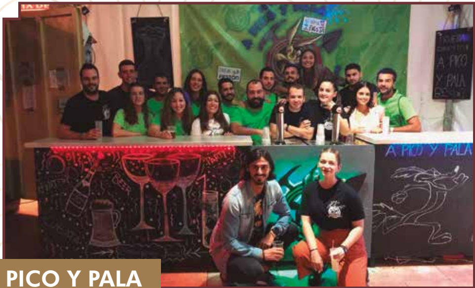
PICO Y PALA