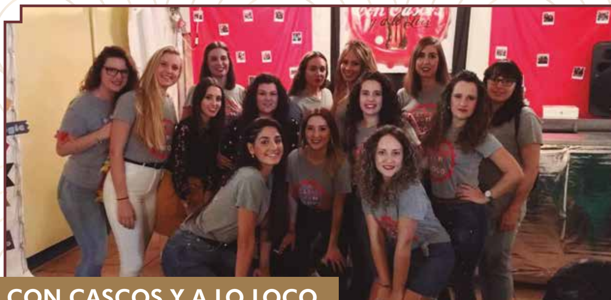
CON CASCOS Y A LO LOCO