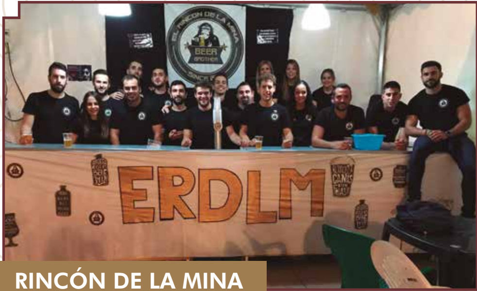
RINCÓN DE LA MINA