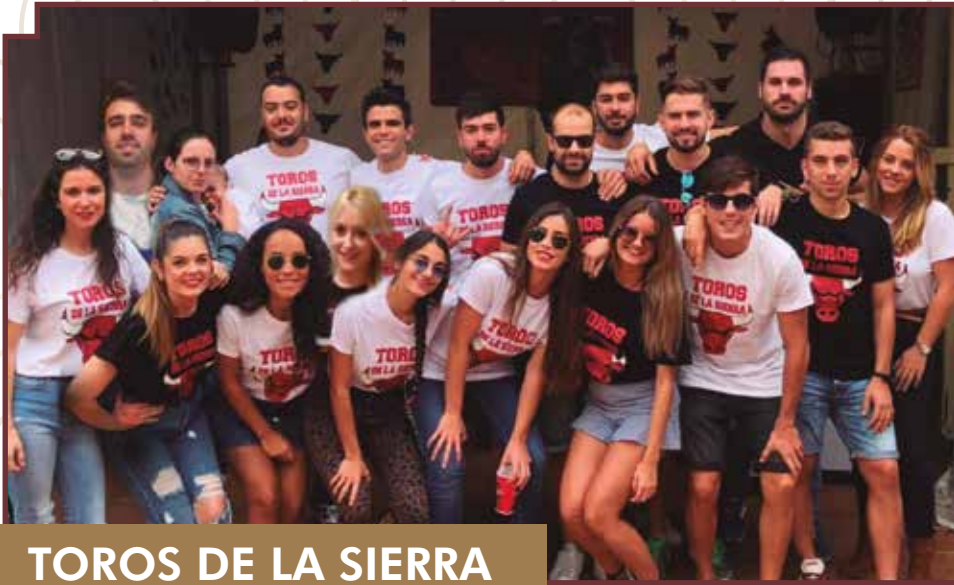
TOROS DE LA SIERRA