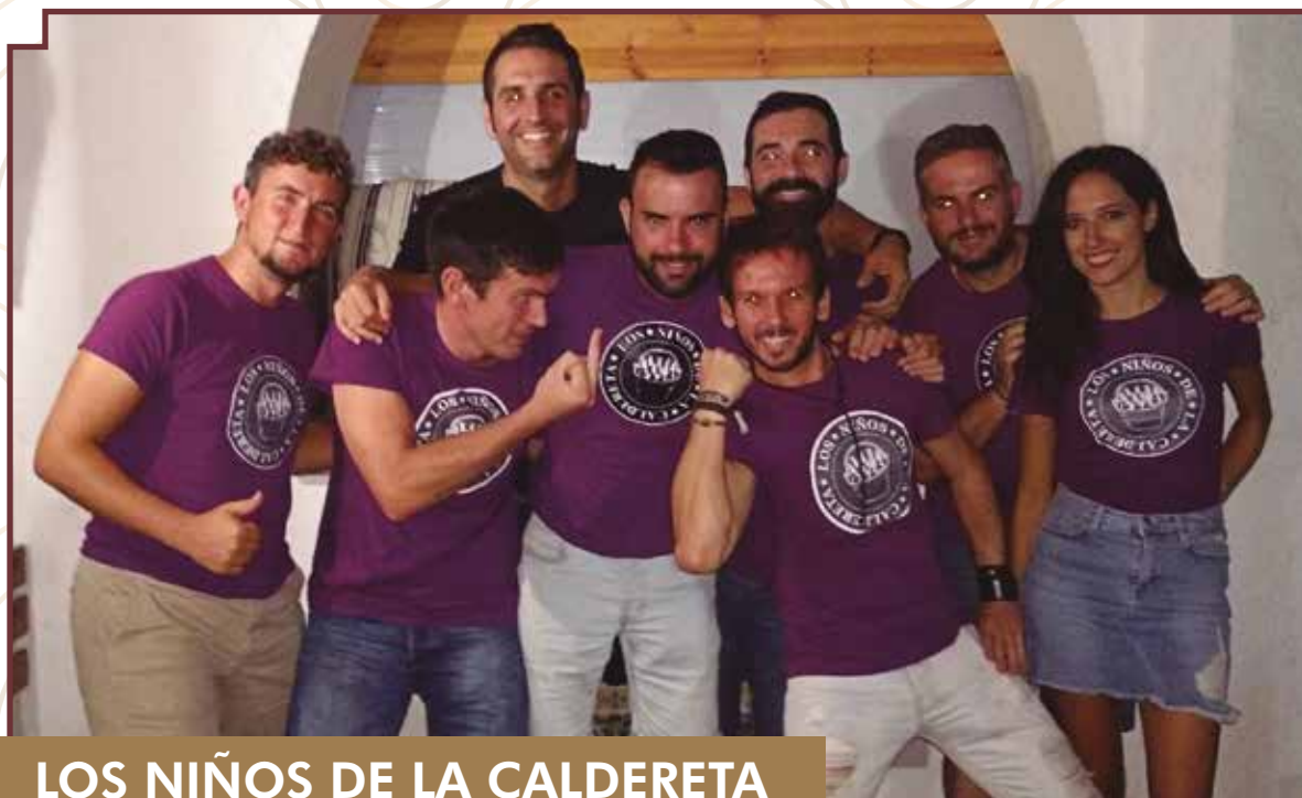
LOS NIÑOS DE LA CALDERETA