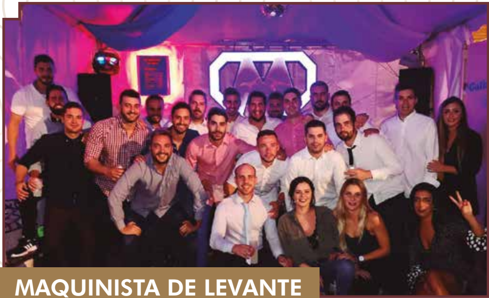
MAQUINISTA DE LEVANTE