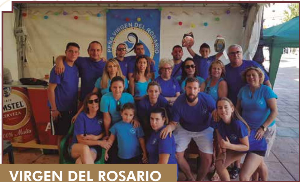
VIRGEN DEL ROSARIO