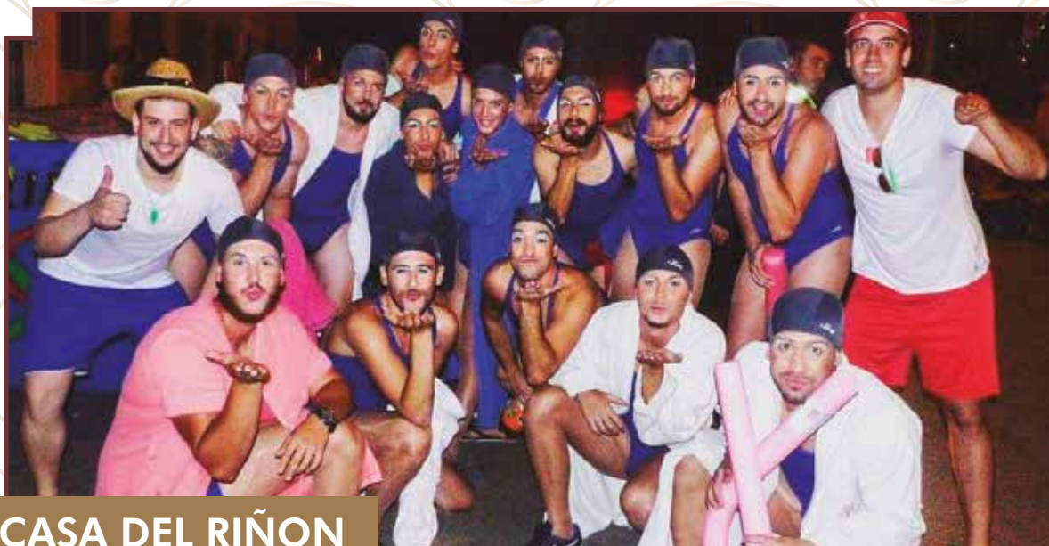
CASA DEL RIÑÓN